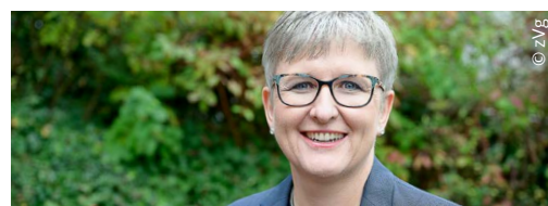
Von der RPK-Präsidentin zur Stadtpräsidentin

Bei allem ist ihr eine gute Work-Life-Balance wichtig. Sie freut sich, dass sie sich mit ihren Fähigkeiten und Gaben auf so vielfältige Weise einbringen kann. Wir wünschen ihr dabei gutes Gelingen und Gottes Segen.