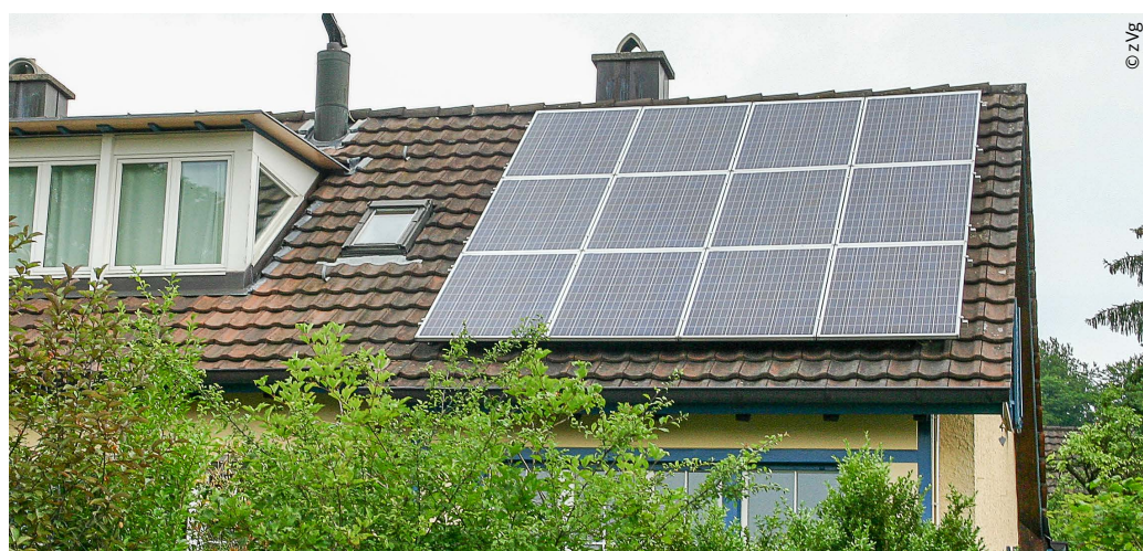
Solarpanels auf dem Dach gehören bald zum Standard.

Wohin der Weg gehen soll, müssen wir jetzt entscheiden, nicht irgendwann. Und soll er am Schild «Energiewende» vorbeiführen, müssen wir leider auch ungeliebte Routen auf uns nehmen. Vielleicht hätte Bundesrätin Doris Leuthard bei der Lancierung der Energiestrategie 2050 deutlicher auf die Binsenweisheit hinweisen sollen, dass der Bär nicht gewaschen werden kann, ohne dass sein Fell nass wird. Oder mit den Worten von Benediktinerpater Anselm Grün etwas poetischer ausgedrückt: «Wenn wir uns nicht bewegen, werden wir erstarren.» Wer in der Kür brillieren will, muss auch zum Pflichtprogramm Ja sagen. Als Belohnung können wir uns dann dafür selber zu Stromköniginnen und -königen kürzen.