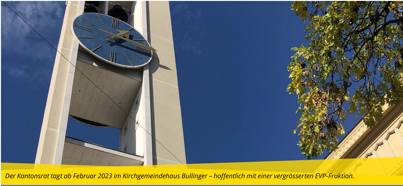
Der Kantonsrat tagt ab Februar 2023 im Kirchgemeindehaus Bullinger – hoffentlich mit einer vergrösserten EVP-Fraktion.